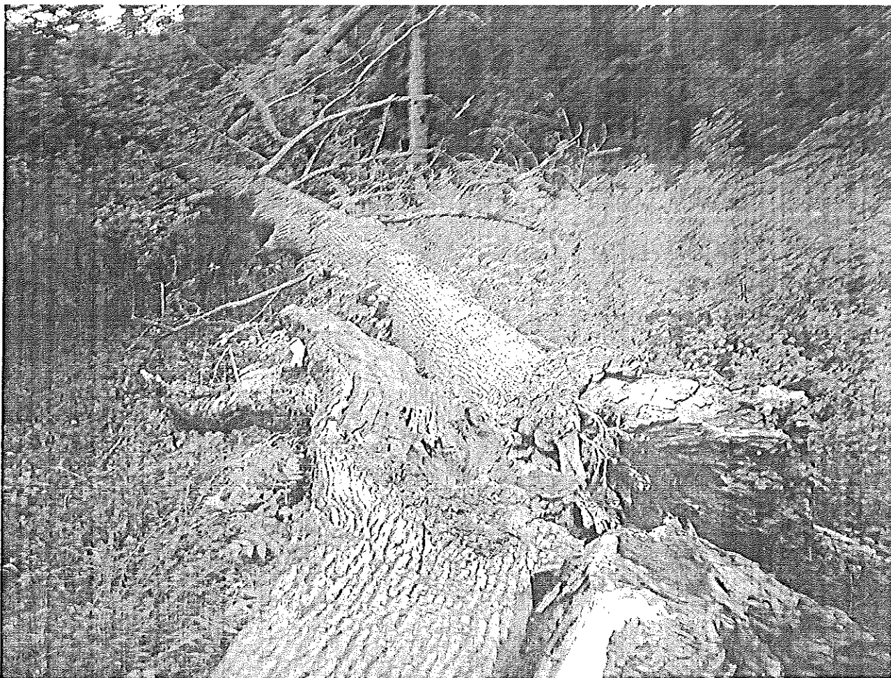
UP V Iclod, ua 38A, pădure proprietate de stat, S=9,9 ha, 11.10.2017